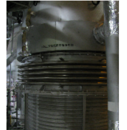
⑪二次空気用空気予熱機