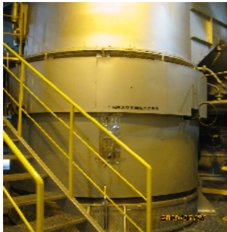
⑬押込空気用空気予熱機