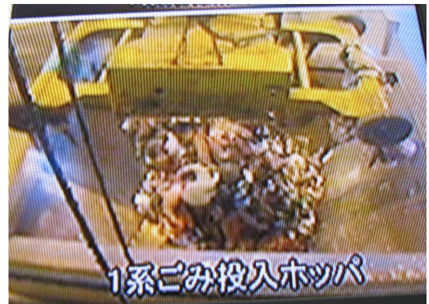
★クレーンが投入する瞬間のごみ投入ホッパー

とくにゅう 投入されたご みが、詰まる 事のないう に、ごみ破碎 機へごみを供 給します。