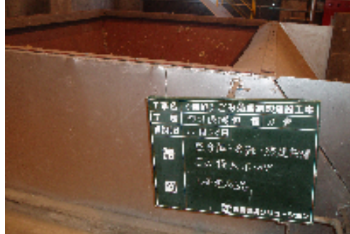
②ごみ投入ホッパー全景