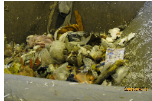
③投入ホッパーへ入れられたごみ