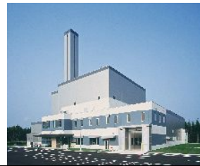
(根室北部広域ごみ処理施設) ねむろほくぶこういきごみしよりせつ